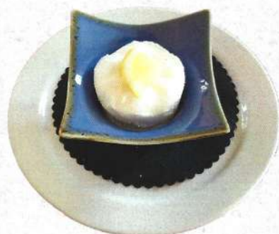
Sorbet / Sorbet 3,50 €