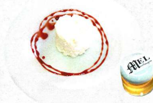
⌘ El mató amb mel de Colera / Mató (fromage frais) avec miel de Colera 4,90 €