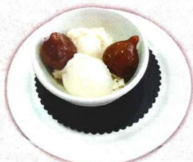
Gelat de ratafia amb figues / Glace ratafia aux figues 5,90 €