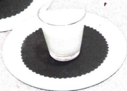
⌘ La mousse de llimona / Mousse au citron 3,50 €