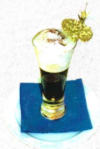
⌘ Cafè irlandès / Irish coffee 6,75 €