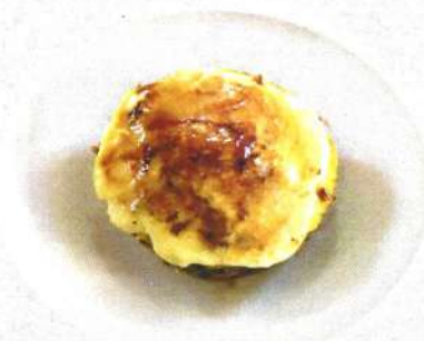
⌘ Pinya natural amb crema catalana / Annanas natur avec cremme catalanne brulée 5,90 €