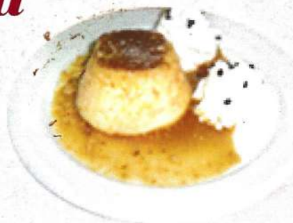
⌘ El flam d'ou amb nata / Flam d'oeuf 3,50 €