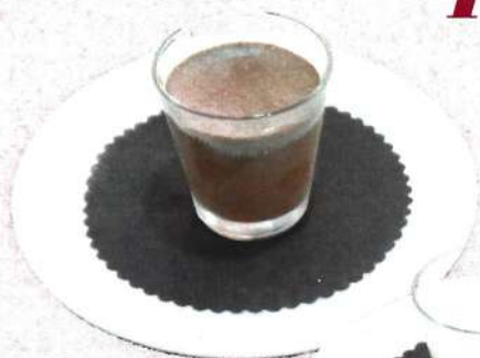
⌘ La mousse de xocolata / Mousse au xocolat 3,50 €