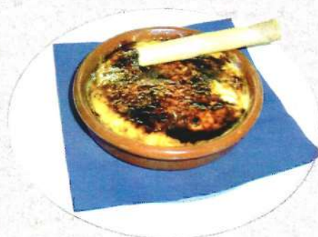
⌘ La crema catalana / Cremme catalanne brulée 4,50 €