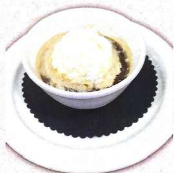
Afogatto / Afogatto 5,90 €