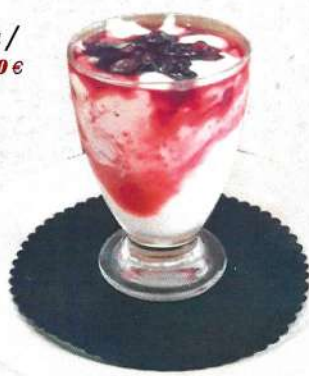
Cremós de iogurt amb fruites del bosc / Crème de yaourt avec fruits rouges 3,90 €